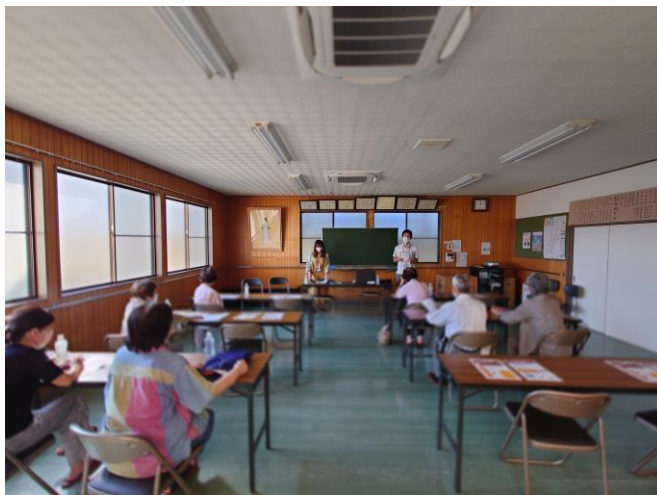
図 1 登録説明会の様子

2022年9月27日（火）、30日（金）の14時から勸永町内会館において、予約型乗合バスの登録方法や利用方法をレクチャーする「利用登録会」を実施しました。10名の方に参加・登録いただきました。ご参加いただきました皆様には、厚く御礼申し上げます。